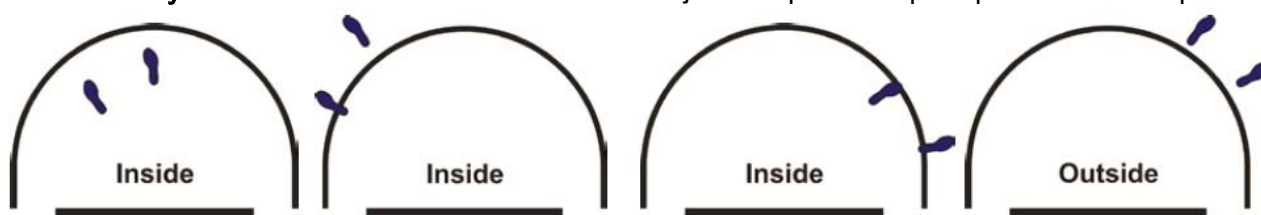
Obrázek 4 Postavení hráče uvnitř/vně území půlkruhu proti prorážení

Výklad: Dovolená hra A1. Pravidlo vztahující se k půlkruhu proti prorážení bude použito.