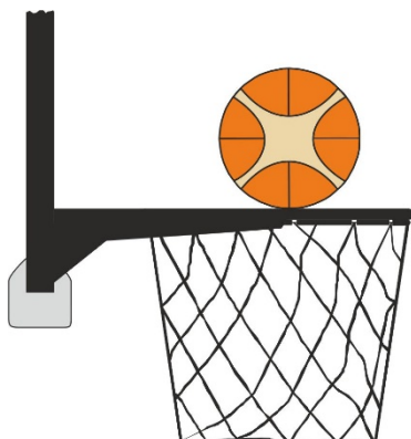
Obrázek 2 Míč v kontaktu s obroučkou